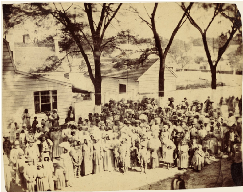
شماری از بردگان در کارولینای جنوبی، آمریکا، ۱۸۶۲، عکس: Timothy H. O'Sullivan. منبع: ویکی‌پدیا