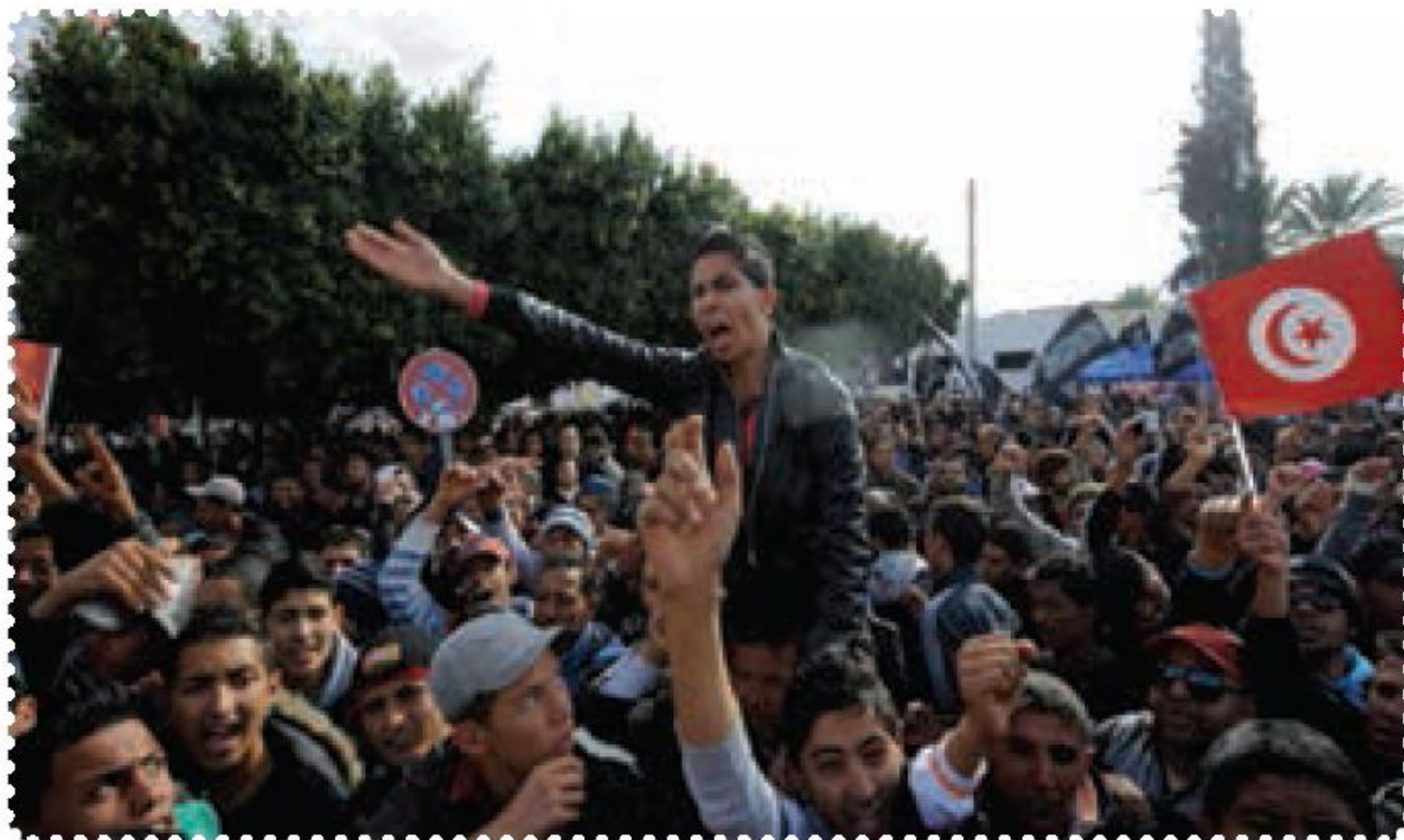
تظاهرات مردم تونس علیه دیکتاتور وابسته به غرب