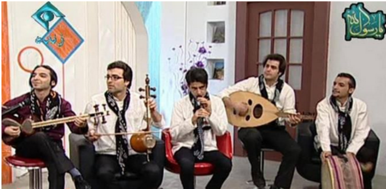
تصویر ۲.۲ از موارد نادر نمایش ساز در تلویزیون دولتی

دو روز بعد، تهیه‌کننده برنامه تلویزیونی «صبح بخیر ایران» در مورد نمایش ساز از شبکه یک تلویزیون دولتی جمهوری اسلامی می‌گوید: «این که برای چند ثانیه سازهای یک گروه موسیقی در تلویزیون به نمایش درآمد، اشتباه من بود و هیچ ربطی به مسئولان صداوسیما ندارد ... در حین اجرای برنامه، اشتباهی از سوی ما سازندگان برنامه روی داد و به مدت ۱۰ ثانیه تصویری از گروه موسیقی به همراه سازهایشان نشان داده شد. تصویری که از سازها روی آنتن تلویزیون رفت، ربطی به تغییر و تحول در نگاه و یا عملکرد سازمان صداوسیما ندارد.» (کیهان، ۱ بهمن ۱۳۹۲)