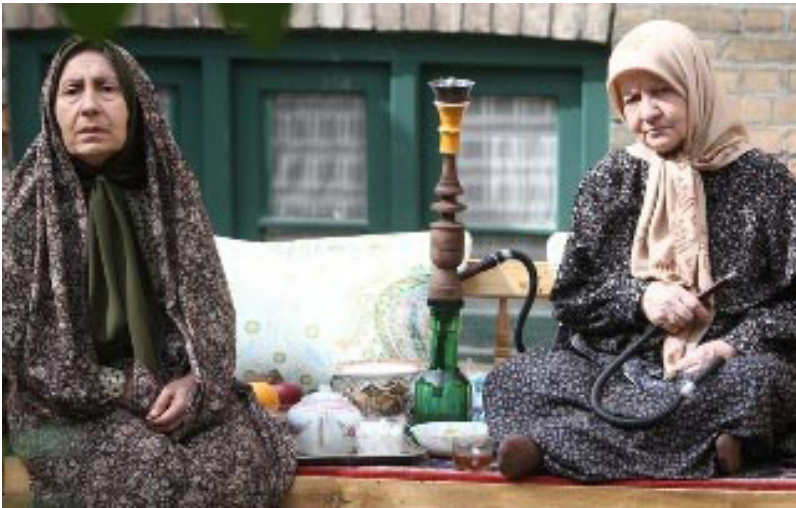
تصویر ۲.۱ لحظه‌ای از بوسیدن روی ماه