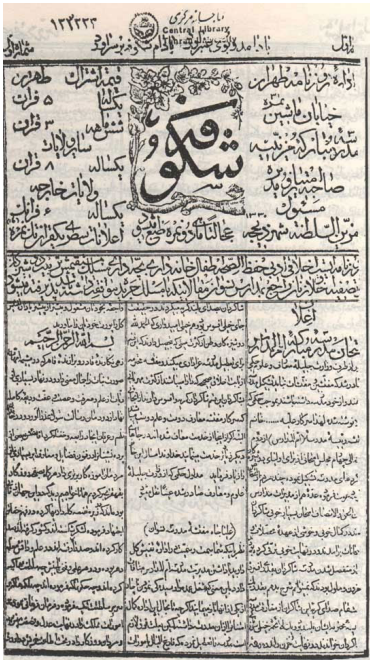
تصویری از روی جلد روزنامه شکوفه

زمین‌های بایر را مانند کالیفرنیا به مردم داده و آبادی او را خواسته، جنگل‌های دستی احداث نموده، رودخانه کرج را به شهر آورده، مردم را از ذلت و کثافت آب‌ها نجات می‌دادم. ۱