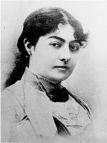
تاج السلطنه؛ دختر ناصرالدین شاه و خواهر مظفرالدین شاه

اغلب سرودست شکسته، بعضی‌ها رنگ‌های زرد پریده، برخی گرسنه و برهنه، قسمی در تمام شبانه‌روز منتظر و گریه‌کننده. و باز می‌گفتم: این‌ها هم زن هستند؛ این‌ها هم انسان هستند؛ این‌ها هم قابل همه نوع احترام و ستایش هستند. ببینید که زندگانی این‌ها چه قسم می‌گذرد. و باز می‌گفتم زندگانی این زن‌های ایران از دو چیز ترکیب شده: یکی سیاه و دیگری سفید. در موقع بیرون آمدن و گردش کردن، هیاکل موحش سیاه‌عزا و در موقع مرگ کفن‌های سفید. من که یکی از همین زن‌های بدبخت هستم، آن کفن