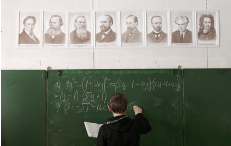
A -13-year-old student learns mathematics at a small school in the remote Russian village of Bolshie Khutora (2012)