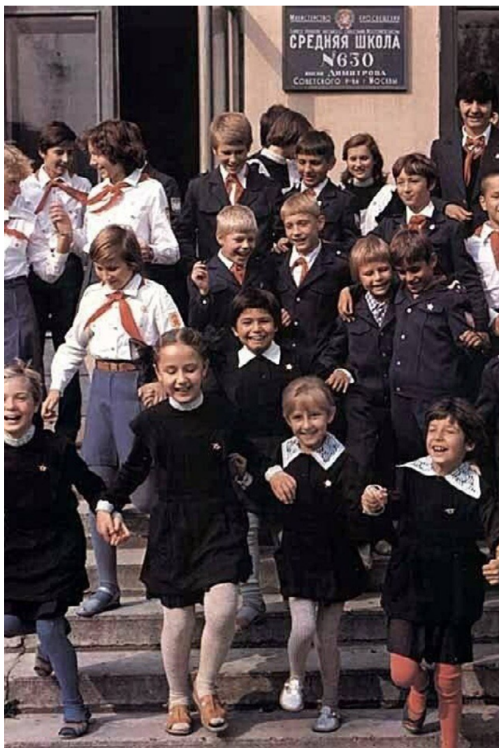
دانش آموزانی که در دوران شوروی سابق یونیفورم مدرسه معمولی می پوشیدند، منبع: Fishki