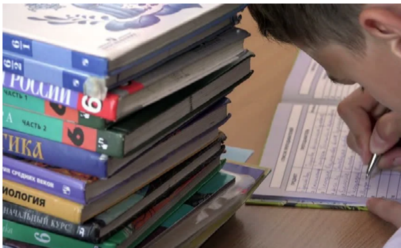
تصویر دانش آموز دبیرستانی که در پترگوف در کنار کوهی از کتاب‌های درسی مشغول یادداشت برداری است، سال ۲۰۱۵