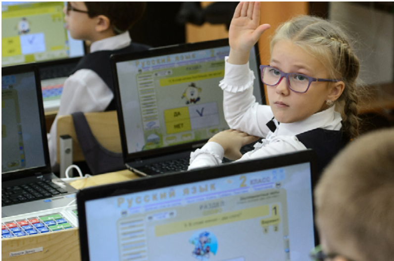
Students use laptops at a lyceum in Novouralsk (2016)