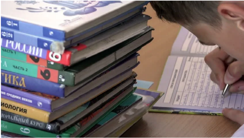
A secondary school student in Petergof takes notes next to a stack of textbooks (2015), Source: shutterstock

Once the Soviet Union fell, however, these goals shifted. Now that Russia was a separate entity from the Soviet republics, Russian history could be foregrounded with barely a nod to Russia's ethnic minorities. Textbooks presented history through the filter of their writers' various ideologies, some depicting socialism as an ideal that Soviet leaders failed to implement correctly, others depicting it as a radical ideology with terrorist and totalitarian leanings. 36 In a new development, some texts departed from the "great man" approach, which focused on political and military leaders, to instead present "history from below," foregrounding ordinary individuals and their lives. 37