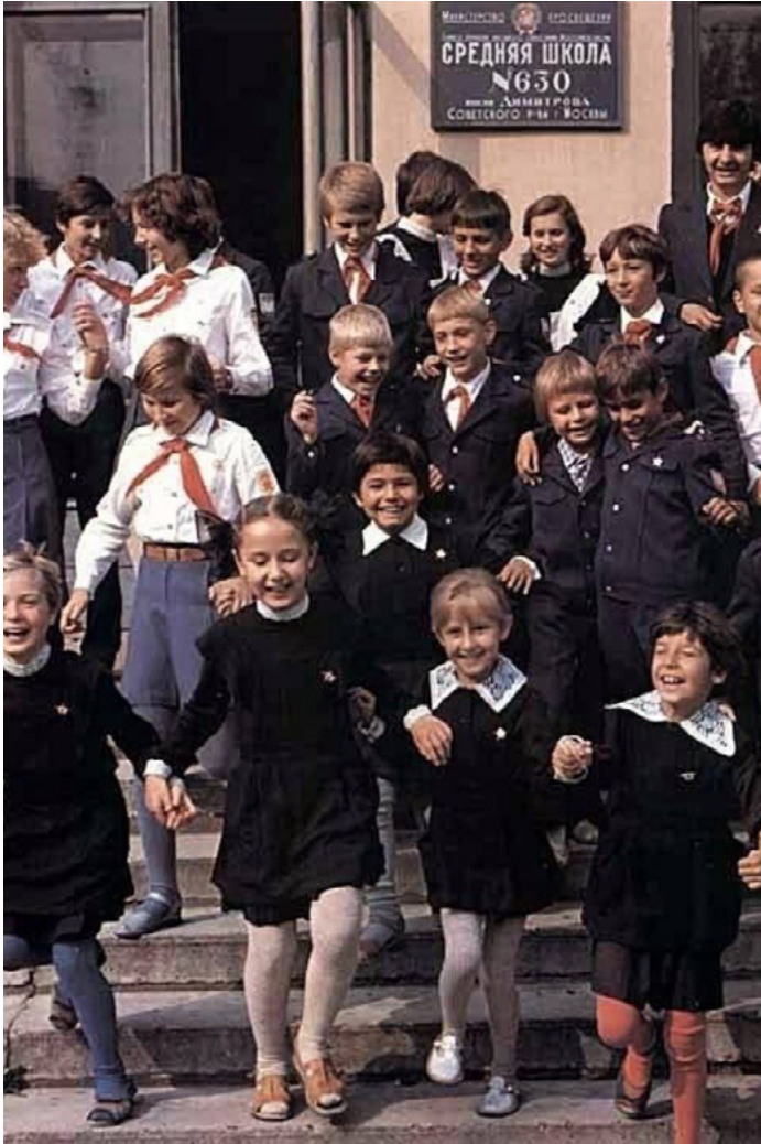
Students wearing typical school uniforms during the Soviet era

In this new environment of freedom, a dizzying array of local educational initiatives popped up, from new types of state-run