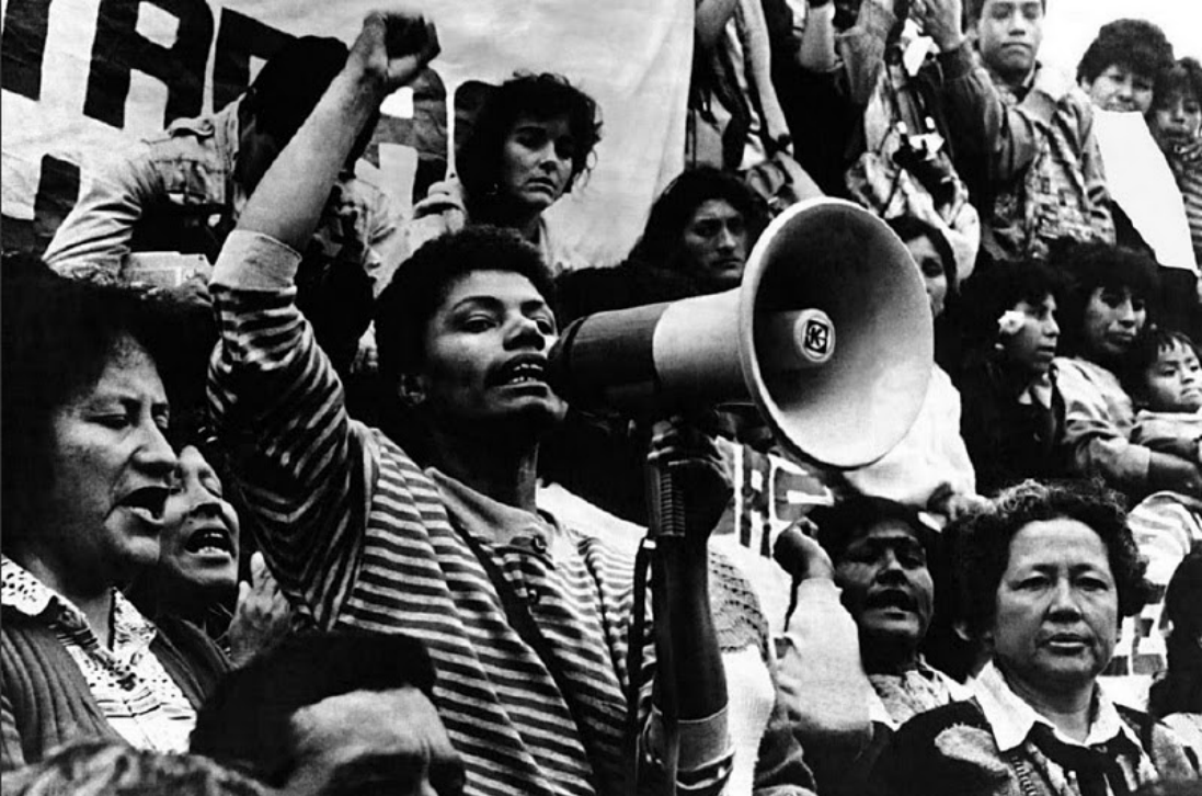
Maria Elena Moyano speaking during a demonstration against the Shining Road Armed Assault on February 14, 1992 (photo)