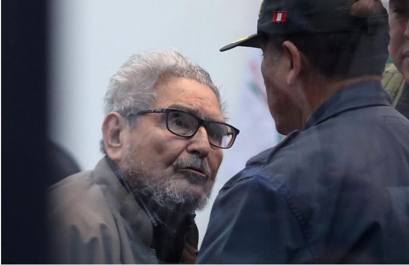
Abimael Guzmán, founder of the Shining Path movement (photo)

Shining Path financed its campaign of terror by levying taxes on peasant growers of the coca plant, which is processed into cocaine; in return, Senderistas would provide fair prices for their crops and protect them from narco-trafficking violence. 1 As Shining Path used these funds to throw Peru into turmoil, the stage was set for Alberto Fujimori's 1990 election to the presidency. As an outsider, his surprise victory was driven in large part by dissatisfaction with the white ruling elite and the political establishment that had failed to avert the crisis gripping Peru.