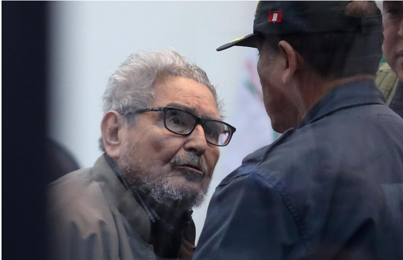
آیمنائل گوسمان، موسس جنبش مسیر درخشان

می‌سازند» به دنبال جلب حمایت دهقانان بومی پرو بودند. ۱ با این حال این افراد فقیر و بومی بودند که در دوران هرج و مرج بیش‌ترین آسیب را دیدند.