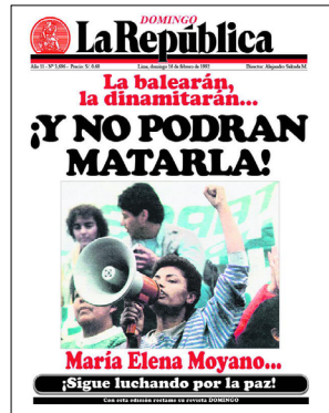
لا ریپابلیکا، یکی از روزنامه‌های برجسته پرو، مویانو را شخصیت سال ۱۹۹۲ نامید (منبع)

مویانو به عنوان یک مخالف صریح گروه «مسیر درخشان»، «تأمینده امید برای کشوری خسته از خشونت و خطری برای کسانی بود که طراح تروریسم بودند» ۳ . او و دیگر اعضای گروه‌های زنان، تظاهرات گسترده‌ای را علیه خشونت سندریستاس‌ها و برنامه ریاضت اقتصادی «فوجی شاک» دولت - که رنج فقیرترین پرویی‌ها را بدتر کرده بود - برگزار کردند. در پایان سال ۱۹۹۱، «لا ریپابلیکا» (La República)، یکی از روزنامه‌های برجسته پرو، مویانو را «شخصیت سال» نامید. مویانو علی‌رغم این که می‌دانست زندگی‌اش در خطر است، اظهار کرد: «ما از کسی نمی‌ترسیم و آماده‌ایم تا جان خود را فدا کنیم.» ۴